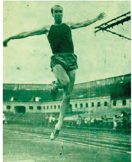
Luis Felipe Areta acumuló 21 records en la prueba de triple entre 1959 y 1968.