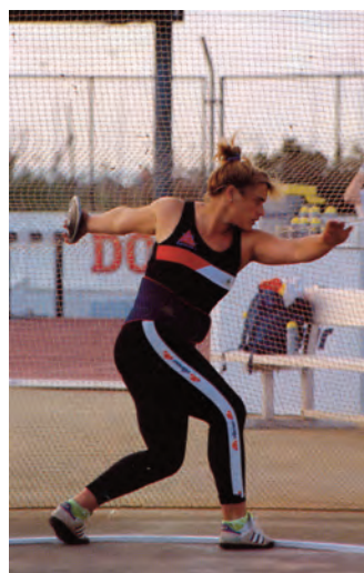
Ángeles Barreiro, la atleta con más años ostentando un record de España: 31 años.