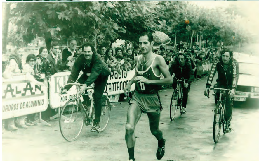
Domingo Catalán ha sido la gran referencia del ultrafondo español. Dos veces campeón del mundo (1987 y 1988) y otra más subcampeón (1992) y autor de cuatro récords.