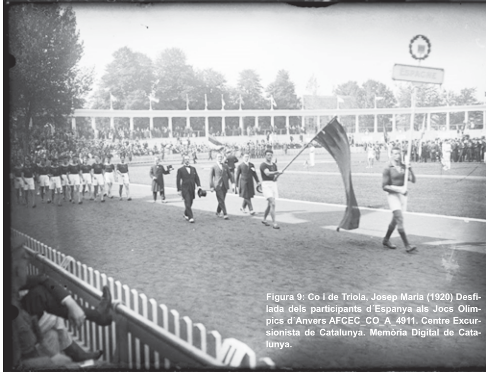
Figura 9: Co i de Triola, Josep Maria (1920) Desfilada dels participants d'Espanya als Jocs Olímpics d'Anvers AFCEC_CO_A_4911. Centre Excursionista de Catalunya. Memòria Digital de Catalunya.