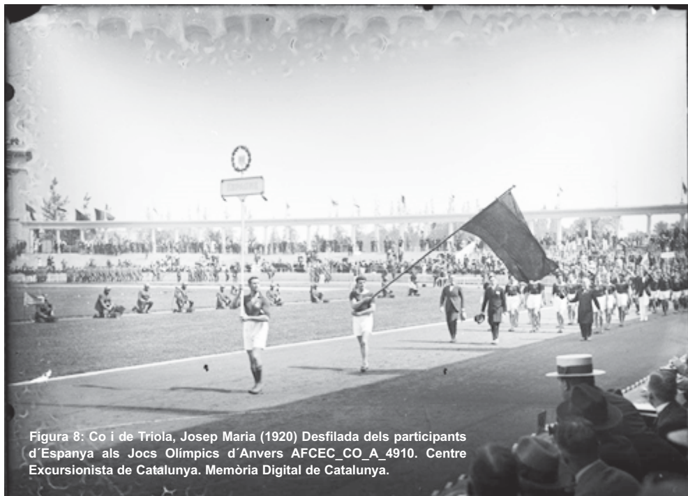
Figura 8: Co i de Triola, Josep Maria (1920) Desfilada dels participants d'Espanya als Jocs Olímpics d'Anvers AFCEC_CO_A_4910. Centre Excursionista de Catalunya. Memòria Digital de Catalunya.