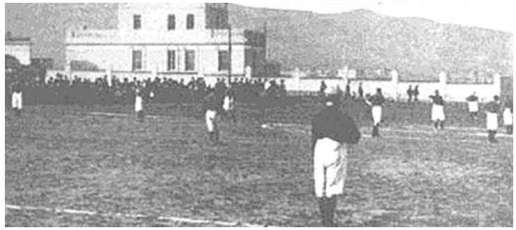
Campo del F. C. Barcelona en 1900