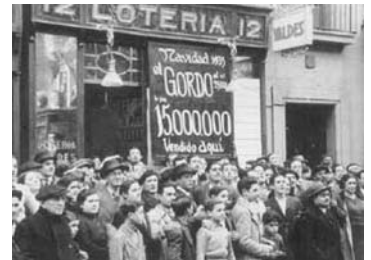
1935. El primer gordo de Navidad de la Administración Valdés: 15 millones de pesetas.

En 1905 obtuvo la licencia para regentar una administración de loterías en las Ramblas, que todavía pertenece a su familia (en la actualidad la regenta un nieto). Cuentan las crónicas que su local de loterías fue lugar de muchas reuniones del club y almacén de material deportivo en la época en que fue directivo del F. C. Barcelona. Mantuvo su forma física de una manera envidiable y siguió practicando fútbol hasta más allá de los cincuenta años, siempre acompañado de su emblemática boina. Falleció el 5 de mayo de 1951.