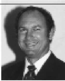
Alberto Juantorena Danger (Cuba) [1987-]