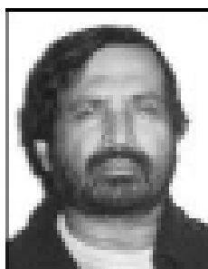
Shri Suresh Kalmadi, MP (India) Representante de Asia [2001- ]