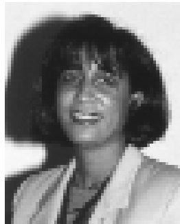
Nawal El Moutawakel (Marruecos) [1995-]