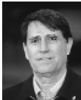
José-Maria Odriozola (España) [1999-]