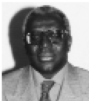
Lamine Diack (Senegal) Presidente [1976- ] [1999- ]

[En el Consejo desde -] [En la posición actual desde-]