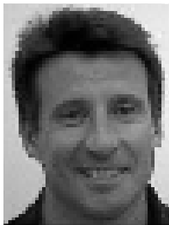
Sebastian Coe (G. B. e I. del N.) [2003-]