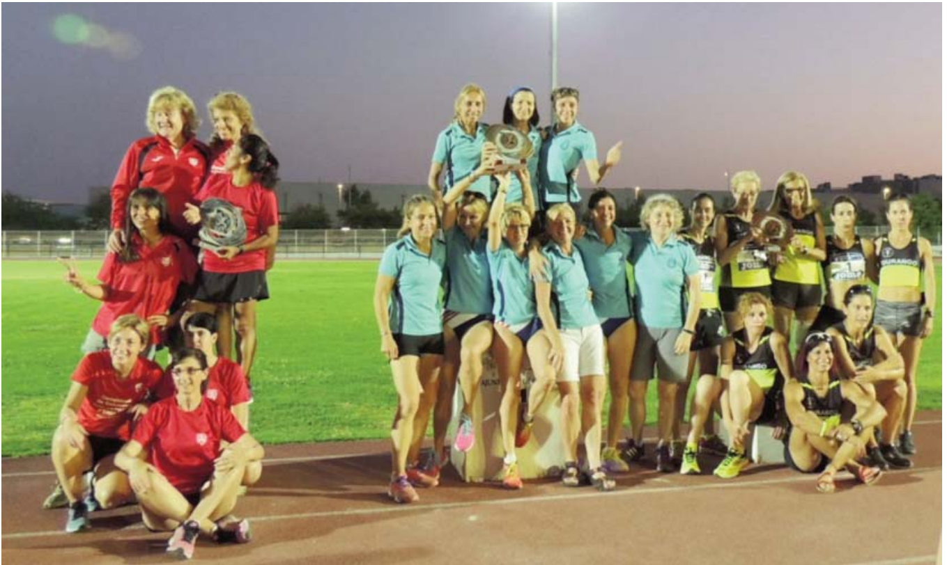
Podio femenino de clubes con el Avinent Manresa en el centro como vencedor; a su lado las chicas del Barcelona At. (segundas) y Durango Kirol Taldea (terceras).