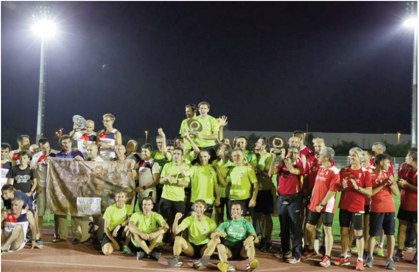
Podio masculino de clubes de 1ª categoría, con el Playas de Castellón en el centro como vencedor; a su lado los chicos del AA Moratalaz (segundo) y A.D. Marathon (tercero).