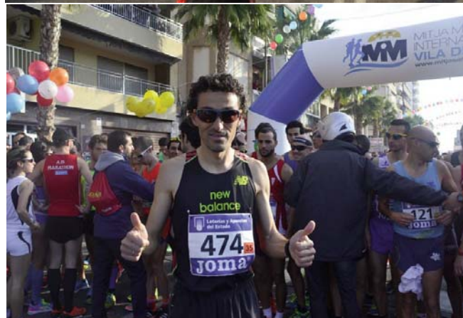
Tres veteranos de lujo en Santa Pola: Juan Carlos de la Ossa, Martín Fiz y Jesús España.