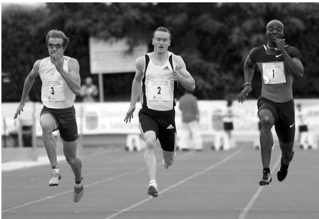
Ángel David Rodríguez (izquierda) camino del récord de España de 100m (10.14) y además, venciendo al plusmarquista europeo de la distancia, el portugués Francis Obikwelu (derecha)