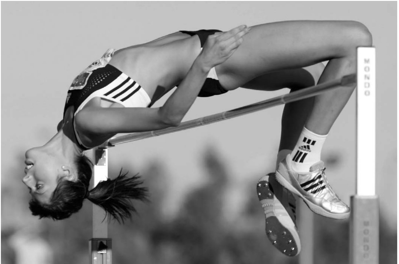
La saltadora croata Blanka Vlasic volvió a ser, un año más, la reina del meeting madrileño