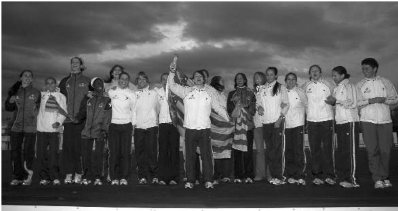
El Valencia Terra i Mar en el podio como subcampeón de Europa de clubes.