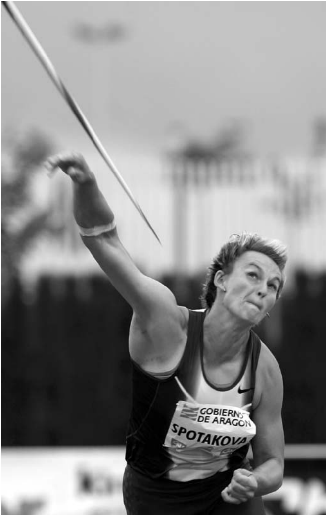
La checa Barbora Spotaková sorprendió a todos bajo la lluvia con una gran lanzamiento en jabalina.

18.62 - (17.95 - 18.62 - 18.23) - 11. Daniel Anglés ESP 18.59 - (17.94 - 18.59 - x) - 12. Germán Millán ESP 17.73 - (x - 17.73 - 17.72)