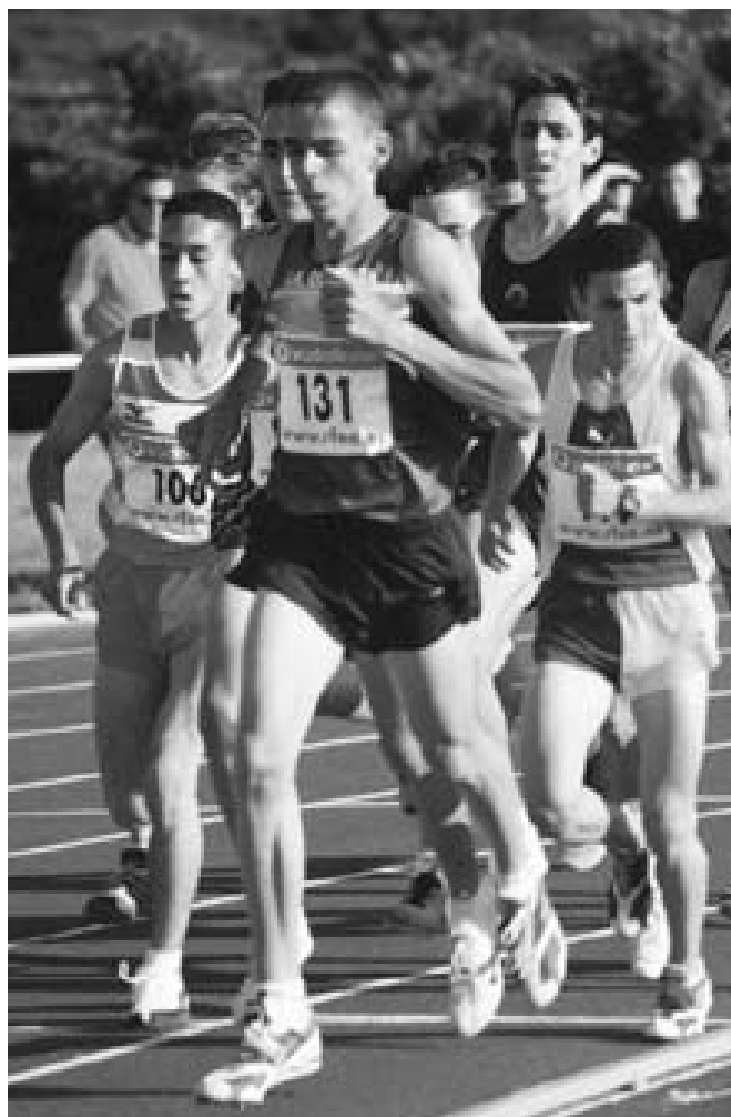
Una imagen de la prueba de 3.000 metros del Campeonato de España Juvenil disputado en Ferrol