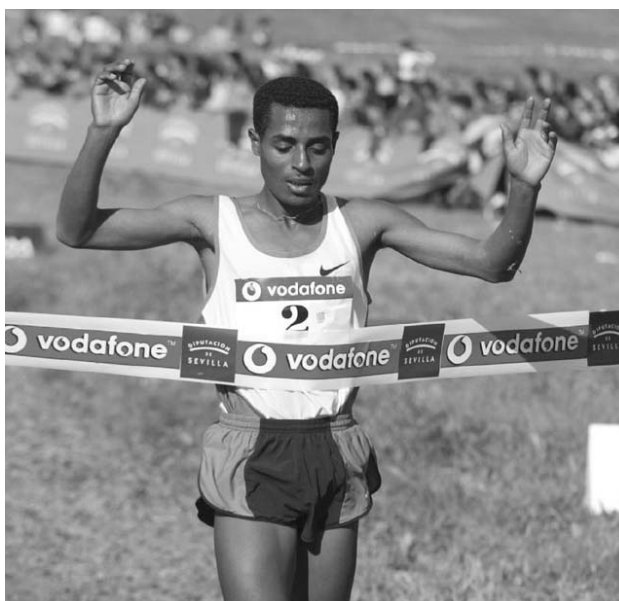
El etíope Kenenisa Bekele no tuvo rival en Itálica.