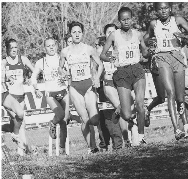
Una imagen de la carrera femenina del Cross de Llodio.