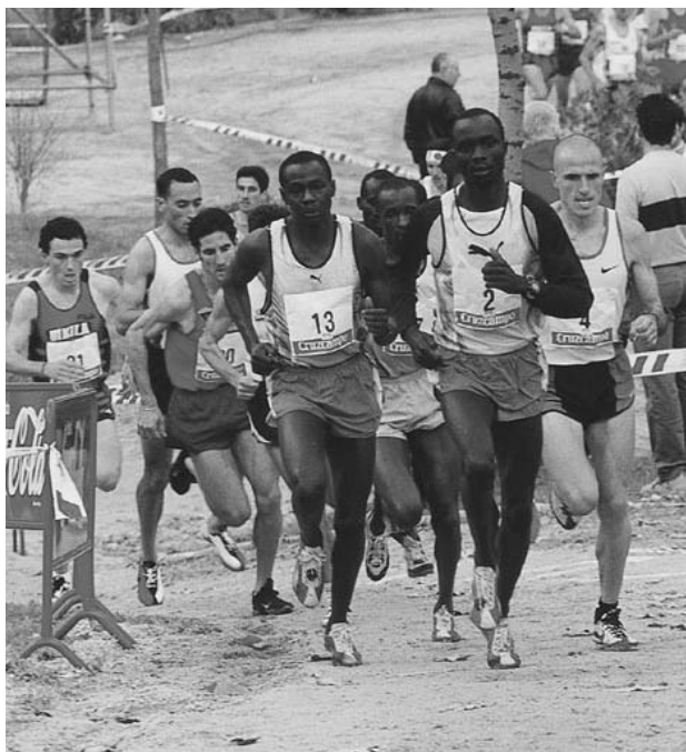
Una imagen de la carrera masculina del cross de Alcobendas.