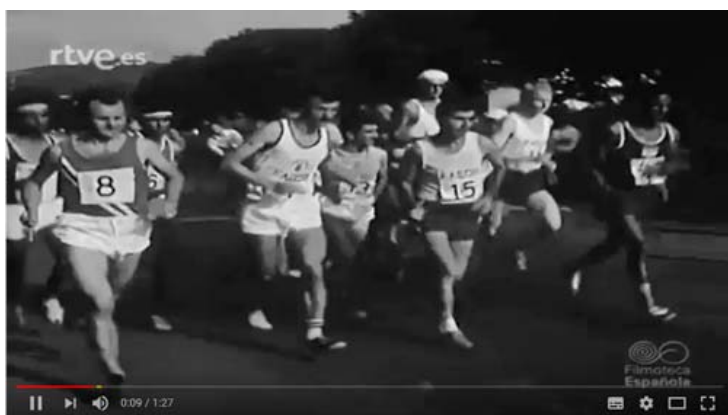
Maratón de Zarauz 1967