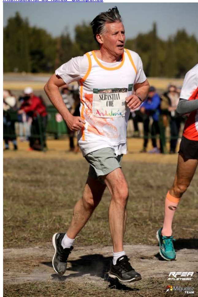
Sebastian Coe (Presidente de la IAAF)

http://rfea.migueliez.photos/evento/19/21012018-XXXVI-Cross-Internacional-de-Italica--Santiponce