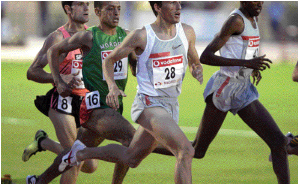
Cornelius Chirchir se impuso con facilidad en la prueba de los 1.500m y Rui Silva fue superado por su compatriota Manuel Damiao

ne más que dominada, sobrepasando esa medida por ¡novena! vez esta temporada, gracias a su cuarto intento de 65,93m. En el 200, Francis Obikwelu dominó con 20.29 (-1.1), pese a realizar una salida nula, al alemán Tobias Unger, 20.42 y al campeón del mundo indoor Dominic Demeritte, con 20.57.