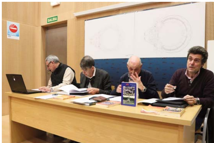
Una momento de la Asamblea, celebrada en el Palacio de los Deportes de Santander.

boletín nº 103 y que recoge más de 2.100 marcas.