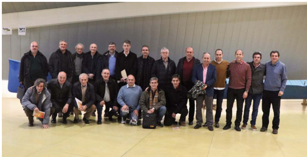
Foto de grupo de los asistentes a la Asamblea de la AEEA celebrada en Santander el pasado 12 de enero.