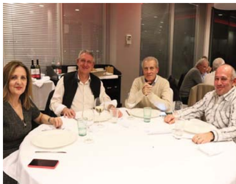
Los miembros de la AEEA disfrutaron de una agradable cena en el restaurante Maremondo de Santander.