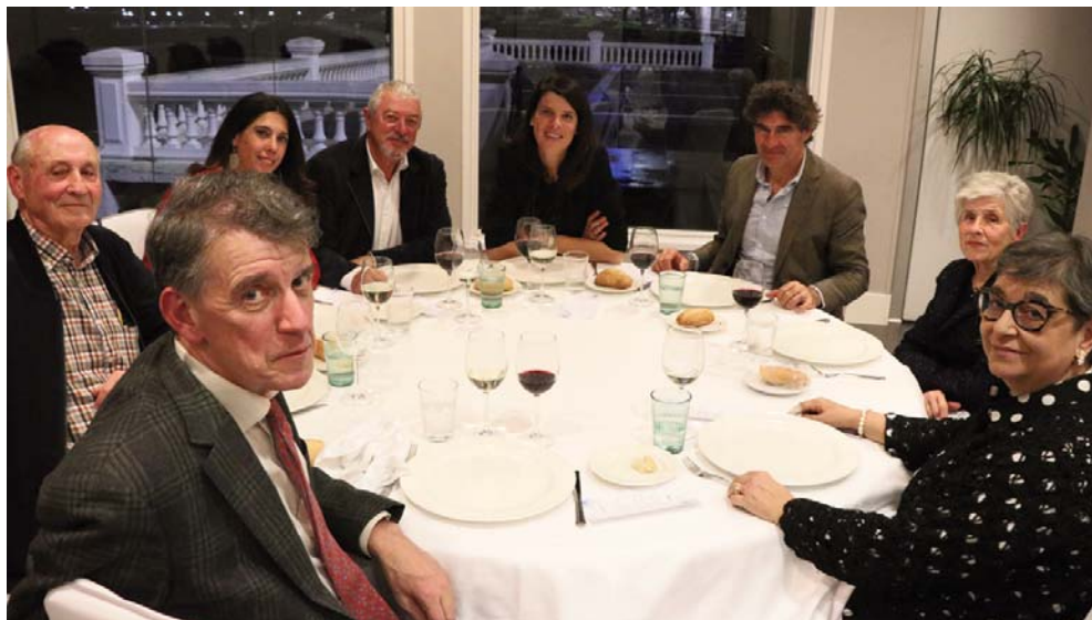
Imagen de la cena posterior en la que se tribuyó un merecido homenaje a la campeona olímpica Ruth Beitia.