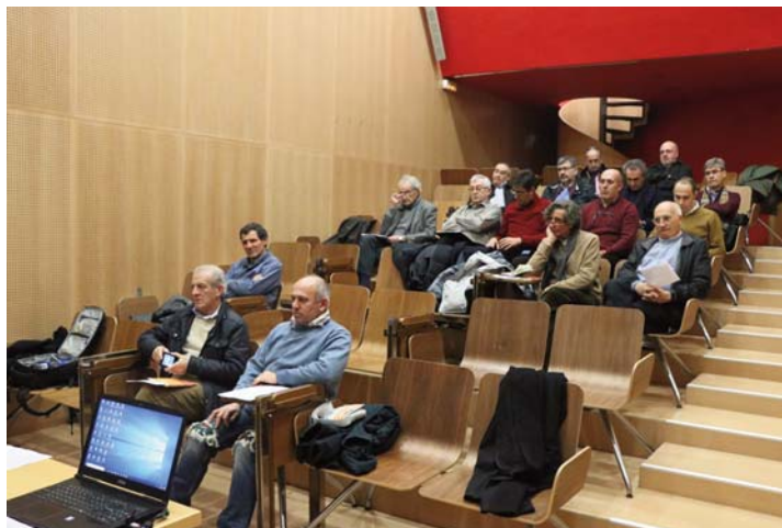
Imagen de los asistentes a la Asamblea, celebrada en la Sala de Prensa del Palacio de Deportes de Santander.

veniencia de cambiar la fecha de la Asamblea al mes de octubre. El principal objetivo es buscar una época en la que la climatología más favorable facilite los desplazamientos de más miembros de la Asociación y también en este caso tener la posibilidad de repasar los temas pendientes de cara al intenso año 2020 que nos espera. Tras un breve debate, se aprueba por parte de los asistentes la celebración de la próxima Asamblea en Madrid en torno al 26 de octubre.