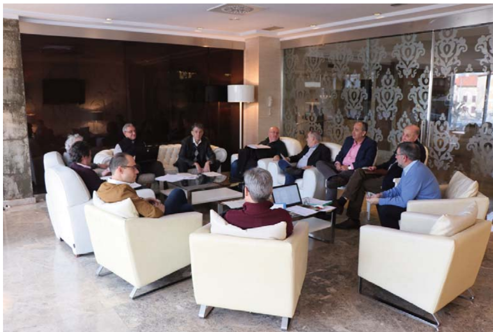
Reunión del Comité Ejecutivo de la AEEA, celebrada en el hotel Santemar por la mañana.