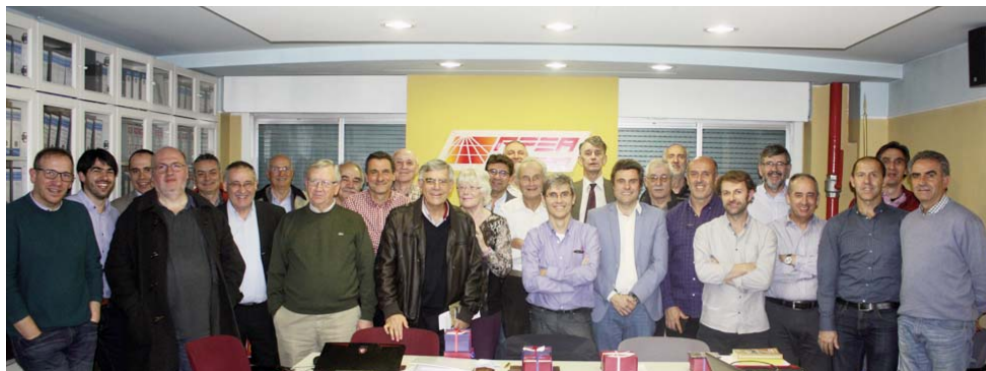
Foto de grupo de los asistentes a la Asamblea de la AEEA celebrada en Madrid el pasado 20 de enero.