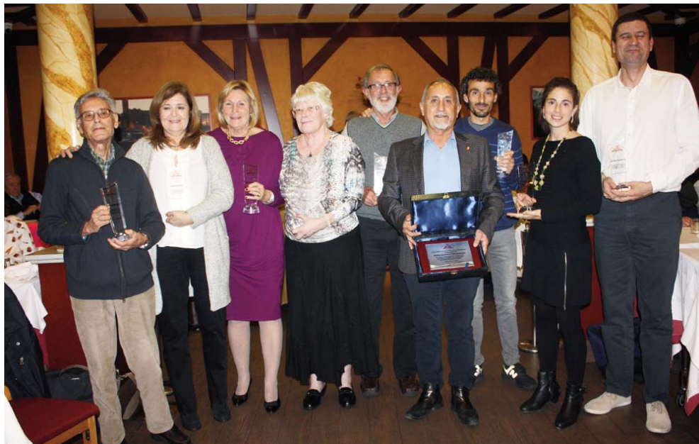
Durante la cena posterior re rindió un homenaje al atletismo madrileño allí presente a través del presidente de la Federación e ilustres atletas madrileños de todas las épocas.