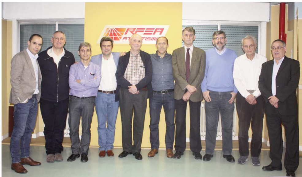
El Comité Ejecutivo de la AEEA al completo.

Y sin más asuntos que tratar se levanta la sesión a las 20.25 horas del día de la fecha.