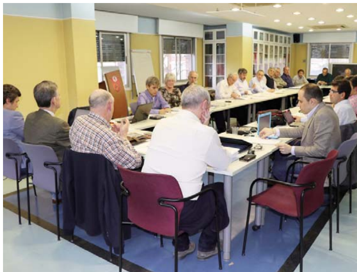
Una panorámica de la Asamblea de la AEEA, celebrada en la sala de reuniones de la RFEA.