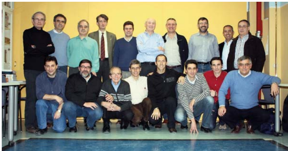
Una imagen de los asistentes a la Asamblea de la AEEA 2010 celebrada en los locales de la RFEA en Madrid.