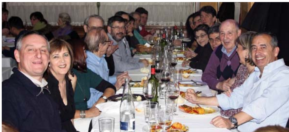
Una imagen de la cena posterior a la Asamblea en un restaurante madrileño.

Y sin más asuntos que tratar se levanta la sesión a las 20:20 horas del día de la fecha.