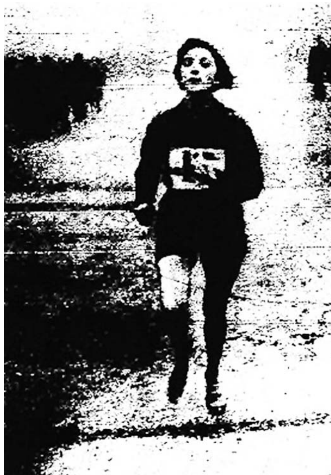
Portes llegando a meta en el Campeonato de París de 1928.

En pista, en el campeonato de París, 3 de junio, fué cuarta en 800m, en una buena carrera: 1º Sebastienne Guyot 2'33"4, Georgette Lenoir 2'34"8,