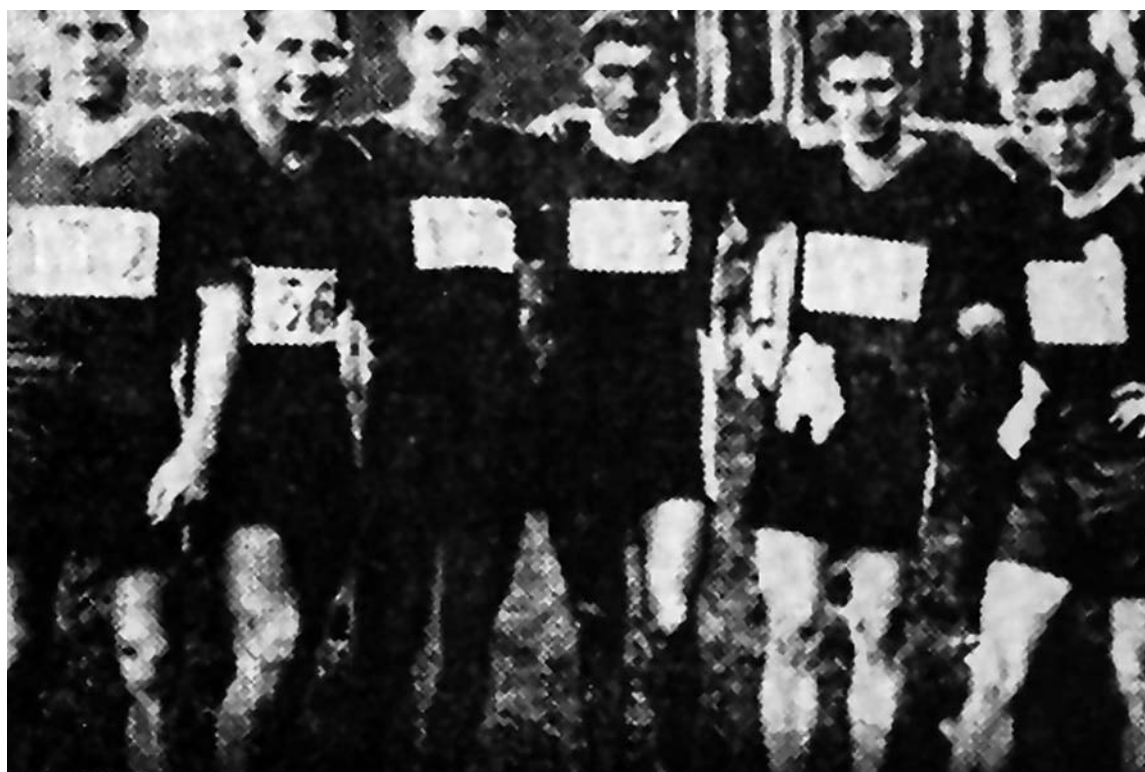
Equipo español que participó en el Cross de las Naciones de 1929 en París.