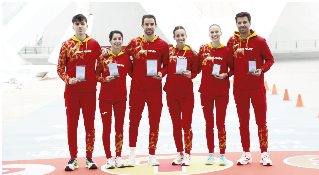
#EspañaAtletismo, bronce en hombres Copa de Europa de Lanzamientos